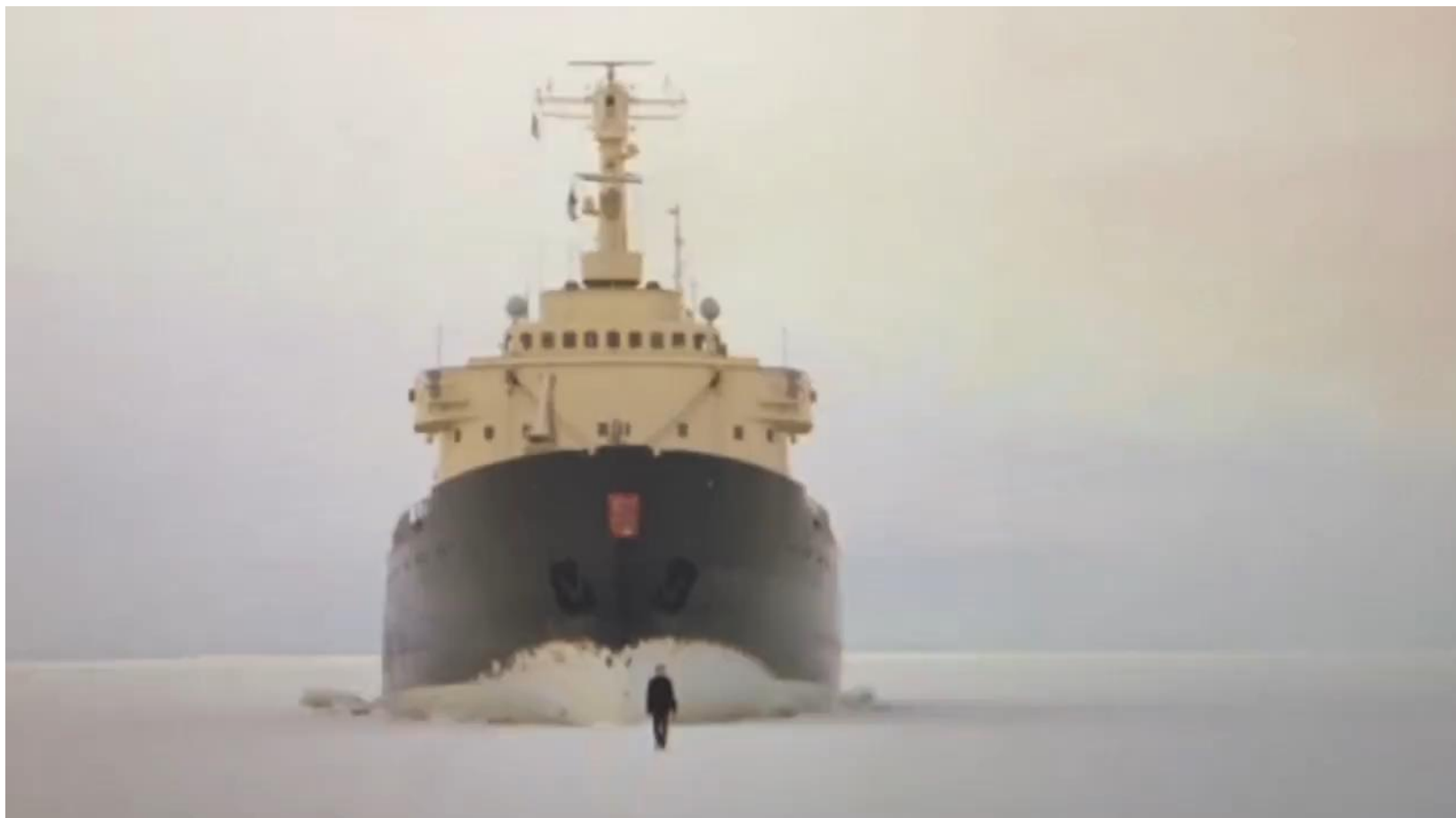
Гвидо Ван дер Верве