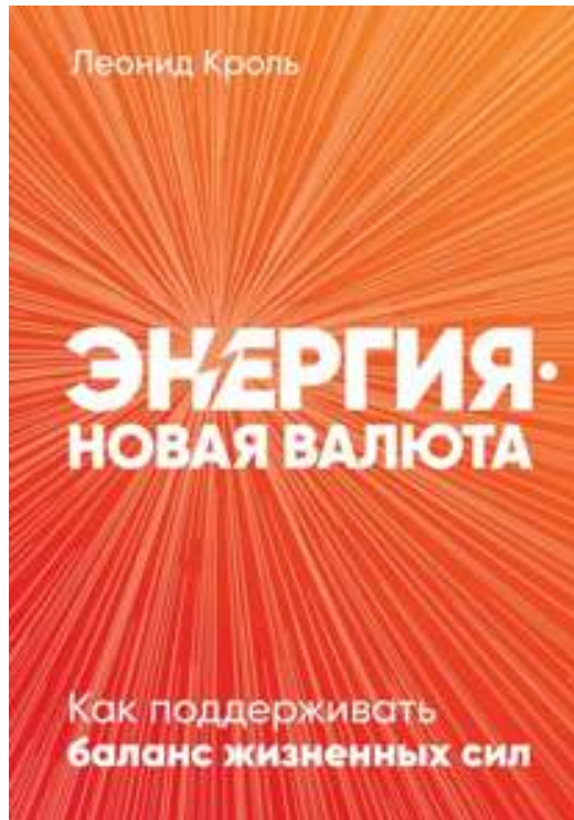
«Энергия – новая валюта»