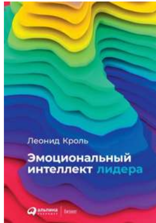
«Эмоциональный интеллект лидера»