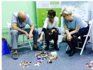
Эмоционально-интеллектуальные семинары и курсы