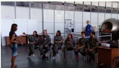
Бизнес игры и культурно-эмоциональные программы

Цель: формирование сообщества лидеров изменений, способных создать эмоционально-интеллектуальную культуру в обществе