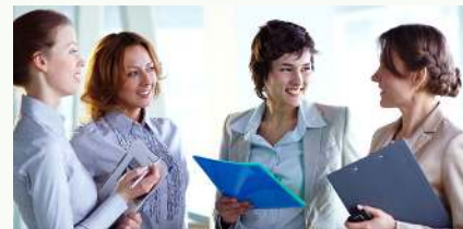
Международные стажировки и курсы повышения квалификации