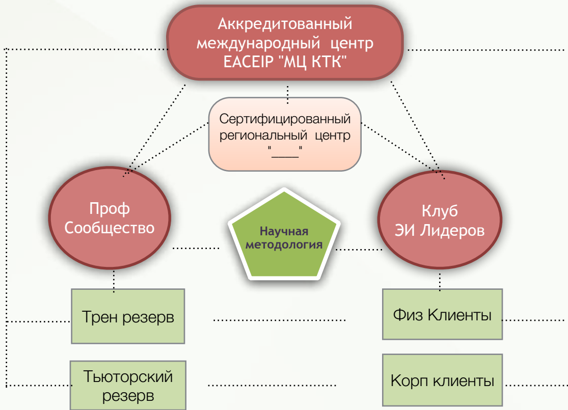
СХЕМА ВЗАИМОДЕЙСТВИЯ УЧАСТНИКОВ